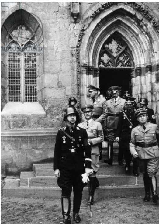
Reichsführer-SS Heinrich Himmler, dahinter Wilhelm Frick und Reichsleiter Martin Bormann (rechts) vor dem Quedlinburger Dom (Stiftskirche St. Servatius), in dem sich das Grab des deutschen Königs, Heinrich I. (919-936) aus der Familie der Liudolfinger (Ottonen) befindet.

Mein Vater, und ich denke, die meisten der Menschen, die an die NS-Idee glaubten, waren gottesfürchtige Menschen. Das Problem, vor dem sie standen und vor dem uns meine Mutter warnte, war, dass die Juden die Religion Christi unterwanderten und vergifteten. Sie warnte davor, dass sie sich schon früh in die Nähe der Kirche begeben hatten, um die Lehre und andere Aspekte zu beeinflussen. Sie können das heute sehen, wie die Katholiken ihre Katechismen verbiegen, um Juden oder jüdische Interessen nicht zu verletzen. Mutter sagte, es könnten Zeiten kommen, in denen alle Gläubigen den Lügen der Juden glauben werden. Ich bin nicht antijüdisch, das müssen Sie wissen, aber wir wurden darauf aufmerksam gemacht, dass einige Juden gut sind und andere an der Spitze eines Krieges gegen uns stehen. Ich hörte, wie mein Vater mit Kameraden darüber sprach, aber das war etwas, was ich damals nicht verstand. In Deutschland gab es eine vorsichtige Haltung gegenüber der Kirche.