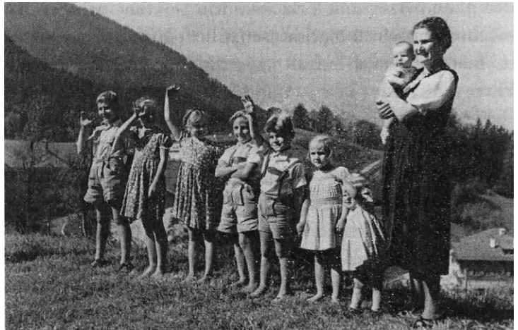
Gerda Bormann mit ihrer Kinderschar, in Erwartung ihres zehnten Kindes, 1943

Also ja, warum bin ich hier in diesem Teil Italiens? In dieser Gegend leben viele ehemalige Reichsbürger, denn es ist eine sehr ruhige Gegend, die sehr autark ist. Die Italiener haben den ehemaligen Deutschen einen gewissen Schutz gewährt und wir haben Tirol zu unserer Heimat gemacht. Ich kam 1945 mit unserer Mutter hierher. Wir hatten ein schönes Haus in Berchtesgaden und die Alliierten zerstörten die Gegend, also mussten wir weg. Wir wurden unter Schutz gestellt und nach Süden in die Bergregionen gebracht, um in Sicherheit zu sein; wir kamen hierher, weil viele Freunde meines Großvaters und Vaters hier waren. Man könnte sagen, wir wurden hier in Sicherheit gebracht, damit die Alliierten uns nicht erwischen konnten. Aber sie kamen und holten unsere Mutter ab, die ich in Panik sah, als sie sie mitnahmen.