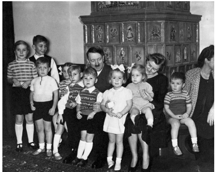
Adolf Hitler und Eva Braun mit den Kindern von Speer und Bormann. Sie wünschen ein gutes 1940.

Mein Großvater war auch dabei, und er, mein Vater und der Führer unterhielten sich angeregt über die Anfänge des Kampfes. Wir hörten, wie sie lachten und sich lautstark und fröhlich unterhielten. Hitler war ein kleiner Scherzkeks, er hatte immer einen Witz auf Lager und zog uns oft an den Ohren oder an der Nase und erzählte dann einen Witz, um uns zum Lachen zu bringen. Sie wissen, dass ich Ihnen einen wenig schmeichelhaften Moment mit ihm erzählen werde, aber ich bin sicher, dass es ihm nichts ausmachen würde, wenn er hier wäre. Einmal, als wir bei ihm zu Hause waren, waren wir mit dem Abendessen fertig und wir Kinder schnappten uns die Malbücher und Puzzles. Hitler setzte sich hin, um uns zu beobachten, und stieß aus Versehen einen sehr lauten Rülps aus. Als Kinder wollten wir natürlich lachen, weil es lustig war, aber wir wussten, dass wir respektvoll sein mussten. Natürlich schaute er zu uns herüber und sagte, er habe sich auf einen Frosch gesetzt, den jemand vergessen habe, ihm zu sagen. Daraufhin konnten wir laut lachen, zur Besorgnis der umstehenden Erwachsenen.