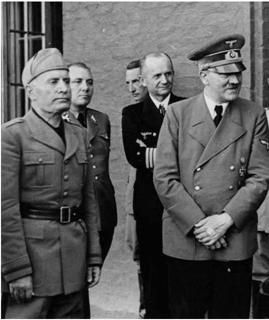
Führerhauptquartier 'Wolfsschanze' bei Rastenburg (Ostpreussen) nach dem Attentat: Benito Mussolini & Reichsleiter Martin Bormann links im Bild.

Die Menschen hier waren also nach dem Krieg gut zu Ihnen? Trotz der alliierten Anschuldigungen wegen Verbrechen?