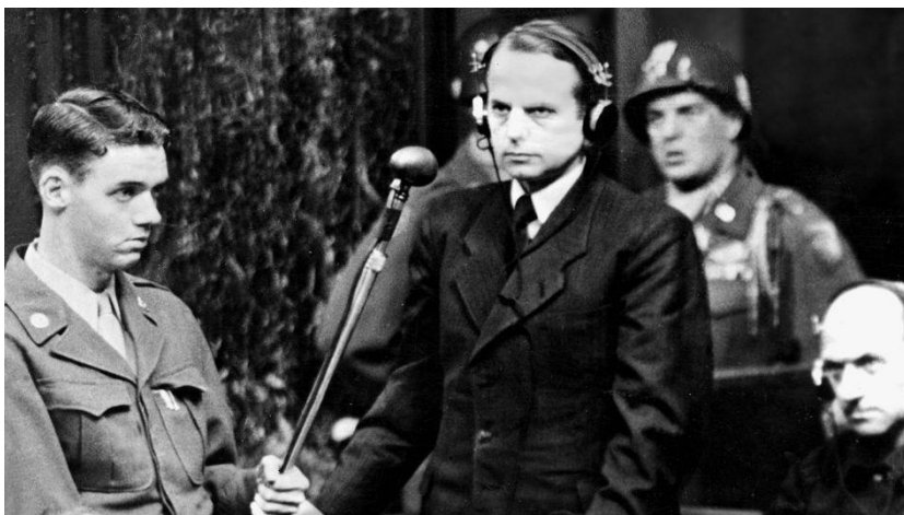
SS-Führer Otto Ohlendorf im Nürnberger 'Einsatzgruppen-Prozess' auf der Anklagebank. Seine früheren Geständnisse wurden unter Folterung von ihm herausgepreßt.