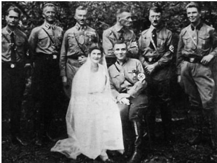
Die Hochzeitsgesellschaft von Martin und Gerda Bormann am 2. September 1929; Walter Buch steht hinter seinem neuen Schwiegersohn. Zu Buchs Linken Adolf Hitler, links außen im Bild Rudolf Heß, beide waren Trauzeugen des jungen Paares.