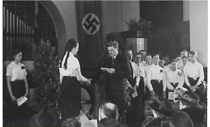
Deutschchristliche Konfirmation 1940 in Esslingen

Ich weiß, dass der Führer den Standpunkt vertrat, dass die Kirche, egal welcher Konfession, die Politik des Reiches nicht kontrollieren konnte. Es war ihnen untersagt, eine solche Macht zu haben, dass sie das Volk entweder auf die katholische oder die protestantische Seite ziehen konnten. Das hatte nichts mit einem Krieg gegen die "Kirche" zu tun, sondern war eher ein Mittel, um sicherzustellen, dass die Kirche, von der viele glaubten, sie stünde unter jüdischem Einfluss, das Volk nicht in die Irre führen konnte. Ich weiß, dass mein Vater eine neue Denkweise in Deutschland voll und ganz unterstützte, die sowohl mit der Bibel als auch mit dem Nationalsozialismus im Einklang stand. Man nannte sie die Deutschen Christen, und mein Vater hatte viele Freunde in dieser Gruppe. Ich finde es interessant, dass viele der führenden Vertreter dieser Idee nach dem Krieg in einer Art Inquisition mittelalterlichen Ausmaßes getötet wurden. Die Partei, die ich kenne, hat sich also gegen jede Art von Korruption oder Mobbing durch die Kirche gewehrt. Mein Vater ist sicherlich mit denen aneinandergeraten, die gegen den Führer und den Nationalsozialismus waren, und das waren einige. Nach dem Krieg konnten sie ihre Version der Ereignisse erzählen, während mein Vater und andere das nicht konnten.